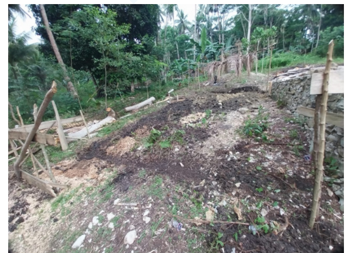
Penggalian dan Penimbunan Manual