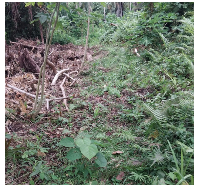
Jalan Utama Keluar Masuk